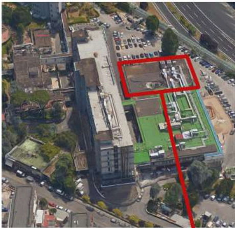
Area oggetto d'intervento